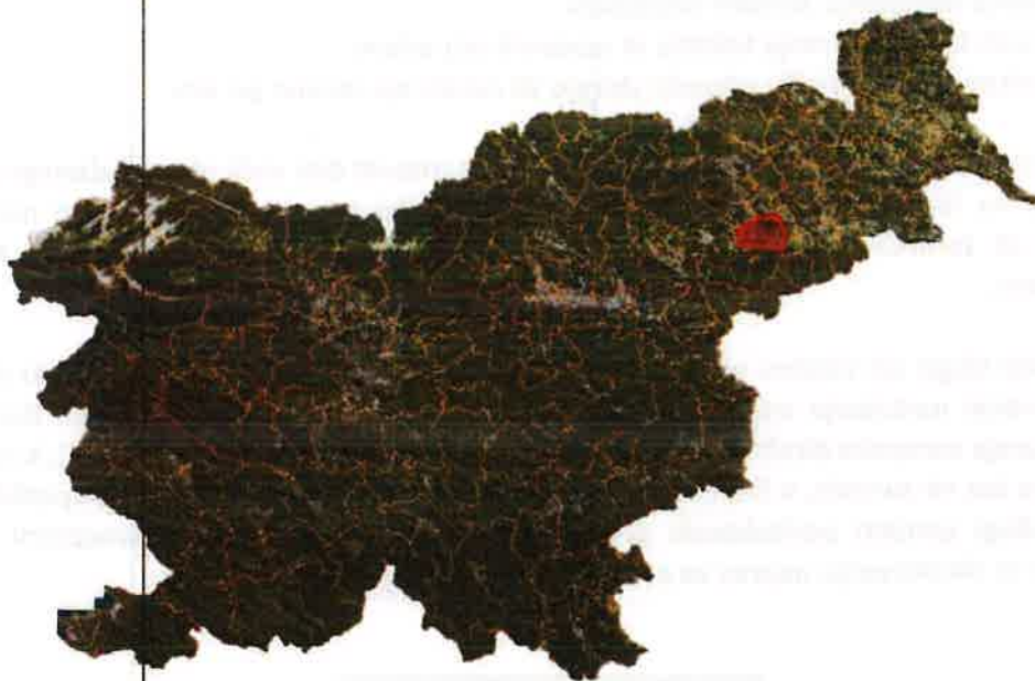
Slika 2: Lega občine Kidričevo