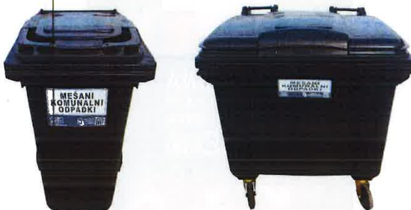
Fotografija 2 in 3: Posode za mešane komunalne odpadke