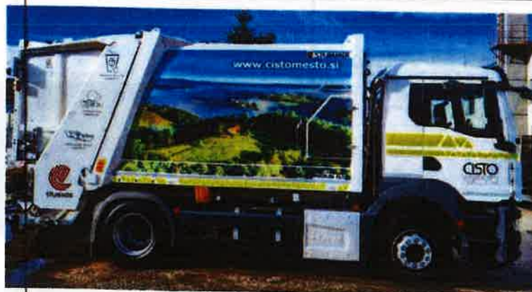
Fotografija 12 in 13: Smetarska vozila