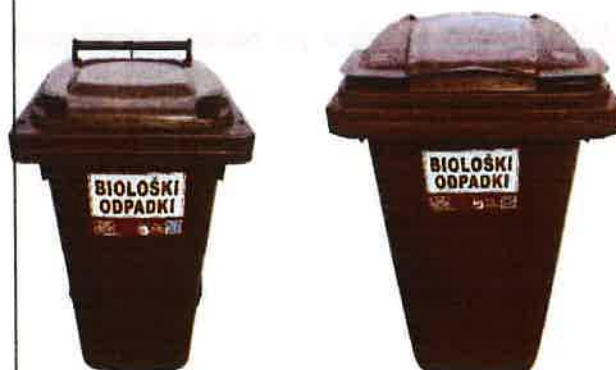
Fotografija 4: Posode za biološke odpadke