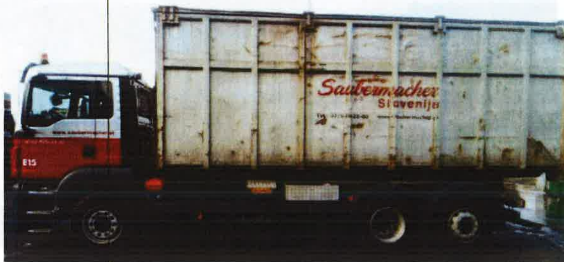
Fotografija 17: Vozilo za prevoz kotalnih prekucnikov

Za prevzemanje in prevoz kosovnih odpadkov uporabljamo kontejnerska vozila ter vozila za prevoz kotalnih prekucnikov.