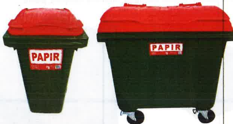
Fotografija 5 in 6: Posode za zbiranje papirja

Za zbiranje plastične embalaže ter ločenih frakcij iz plastike bomo uporabljali: