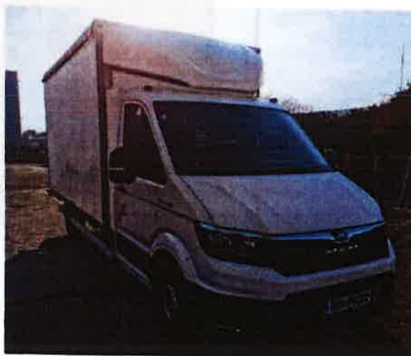
Fotografija 18: Vozila za prevoz in zbiranje nevarnih odpadkov

Za zbiranje in prevoz nevarnih frakcij uporabljamo specialna vozila, s pokritim kesonom in dovoljenjem za prevoz nevarnih snovi.