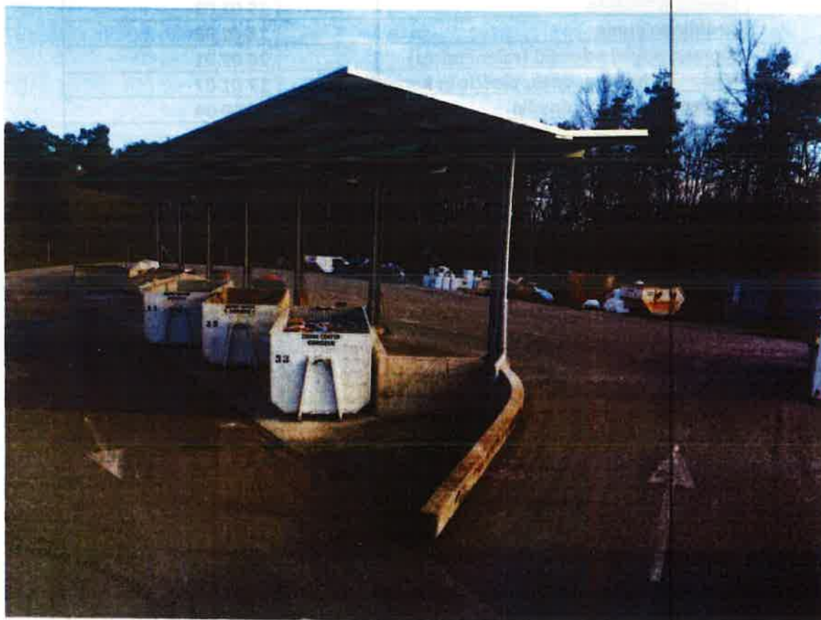
Fotografija 1: Zbirni center Kidričevo

Datumi obratovanja zbirnega centra bodo navedeni na koledarju odvoza odpadkov ter na spletni strani https://cistomesto.si/zbirni-centri/ .