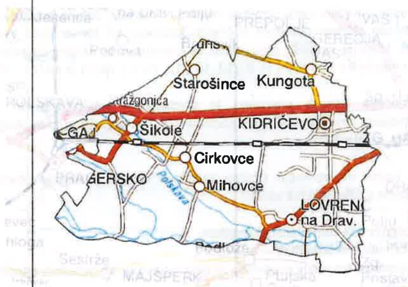
Slika 1: Zemljevid občine Kidričevo