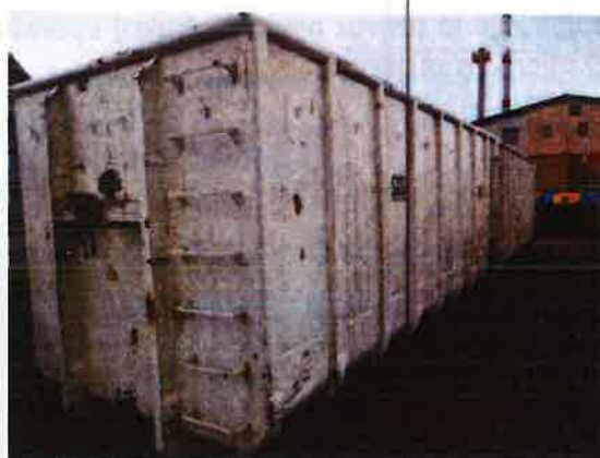
Fotografija 15 in 16: Kontejnerji različnih volumnov za zbiranje kosovnih in drugih odpadkov