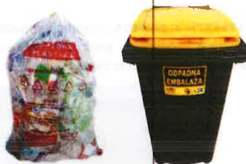
Fotografija 7: Vrečka za mešano embalažo

Za zbiranje steklene embalaže, uporabljamo plastične zabojnike, volumnov 240 l in 1100 l in sicer: