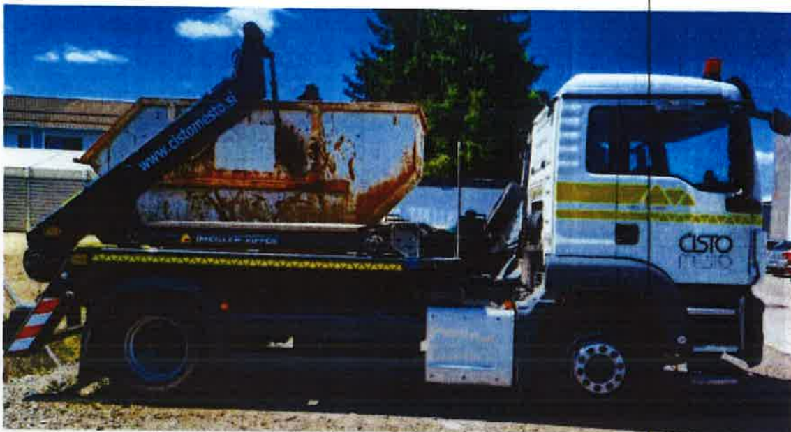
Fotografija 14: Vozilo za prevoz kontejnerjev

Za zbiranje in prevoz odpadkov iz zbirnih centrov, uporabljamo specialna komunalna vozila za odvoz kontejnerjev večjega volumna: