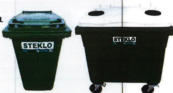
Fotografija 8 in 9: Posode za zbiranje stekla (steklene embalaže)