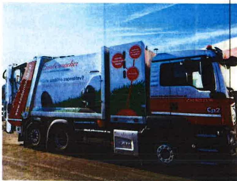
Fotografija 19: Vozilo za pranje zabojnikov za zbiranje bioloških odpadkov