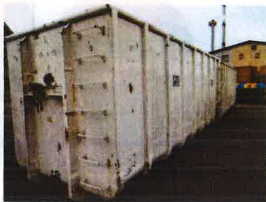
Fotografija 10 in 11: Kovinski kontejnerji